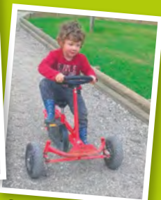
Kart à pédales