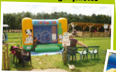
Panier des chiots